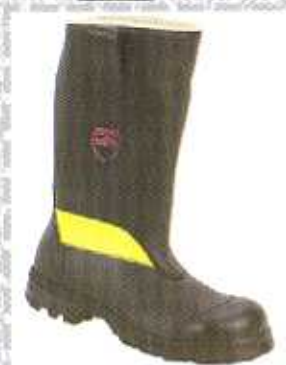
9204-2 mit Schnittschutz Klasse I zertifiziert