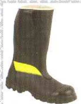
9204-3 mit atmungs- aktiver Membran