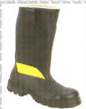
9204-1 voll Nappaleder gefüttert